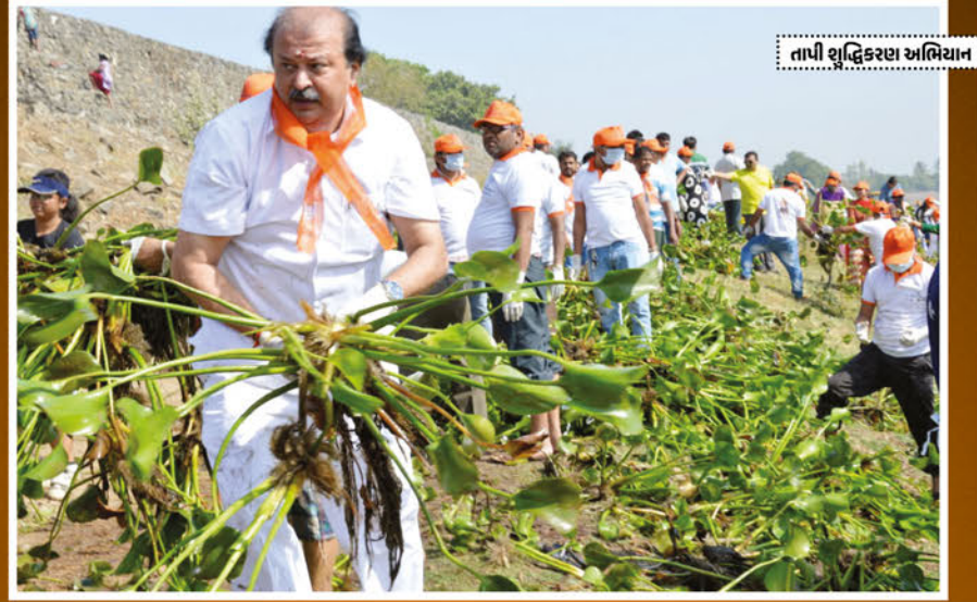
તાપી શુદ્ધિકરણ અભિયાન