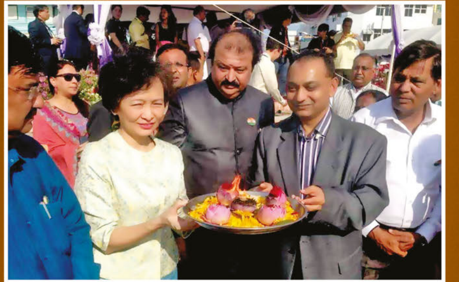
સુરત યાત્રી સ્થાપના ના 100 વર્ષ નિમિત્તે શાઇલેન્ડ ખાતે સંબોધન