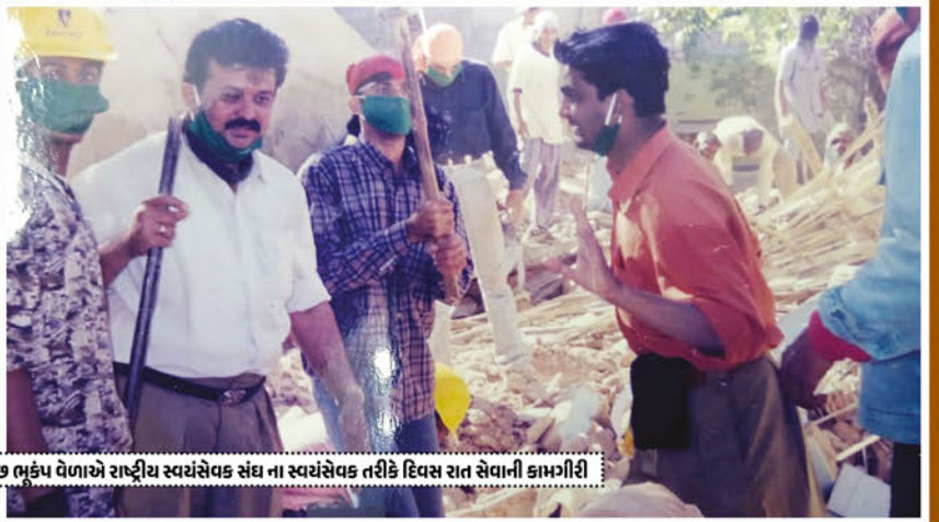
કચ્છ ભૂંડપ વેળાએ રાષ્ટ્રીય સ્વયંસેવક સંઘ ના સ્વયંસેવક તરીકે દિવસ રાત સેવાની કામગીરી