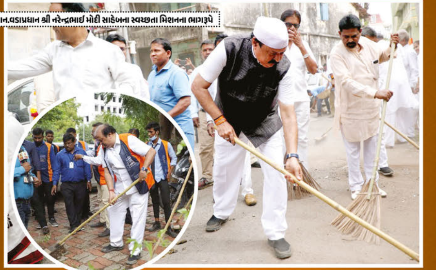
માનવડાપ્રધાન શ્રી નરેન્દ્રભાઈ મોદી સાહેબના સ્વચ્છતા મિશનના ભાગરૂપે