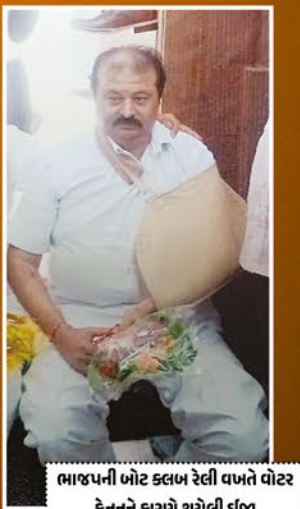
ભાજપની બોટ ક્લબ રેલી વખતે વોટર કેનને કારણે થયેલી ઈજા