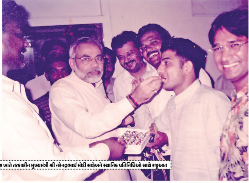
કચ્છ ખાતે તત્કાલીન મુખ્યમંત્રી શ્રી નરેન્દ્રભાઈ મોદી સાહેબને સ્થાનિક પ્રતિનિધિઓ સાથે રજૂઆત